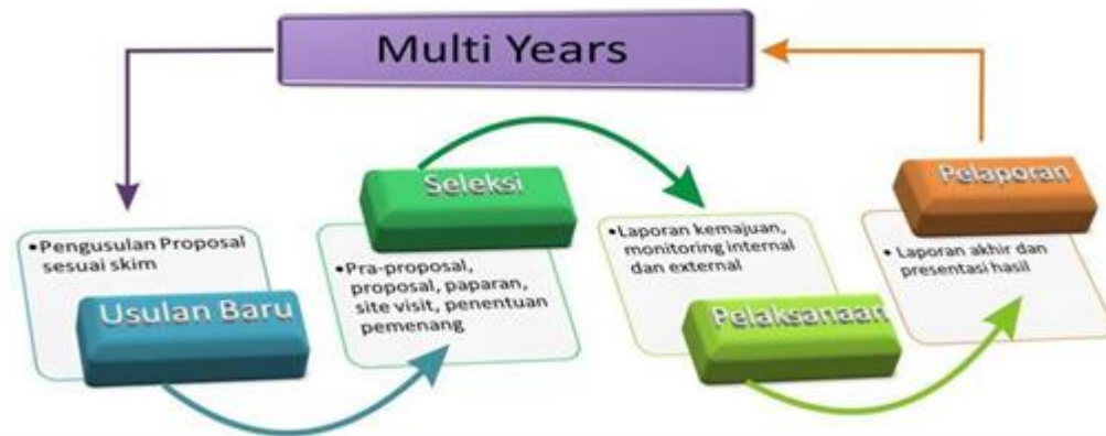
Gambar 2.1 Tahapan Kegiatan Penelitian yang didanai Direktorat PPM Universitas Telkom